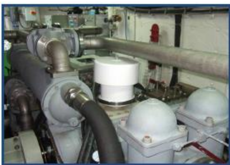
Pielietojums ātruma kārbai